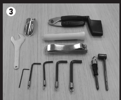
③ 著者がいつも携帯しているメンテナンス道具。工具以外にも爪切りを所持し、身体のメンテもバッチリだ!